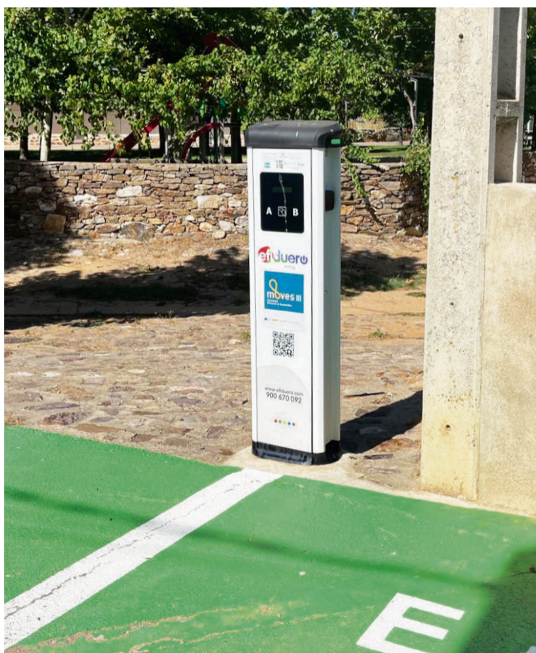
PUNTO DE RECARGA EN ALMARAZ DE DUERO (Zamora) / AECT Duero-Douro

Te invitamos a llamarnos en el 900 670 092 o escribirnos un email a efiduero@efiduero.com y estaremos encantados de resolver todas tus dudas.