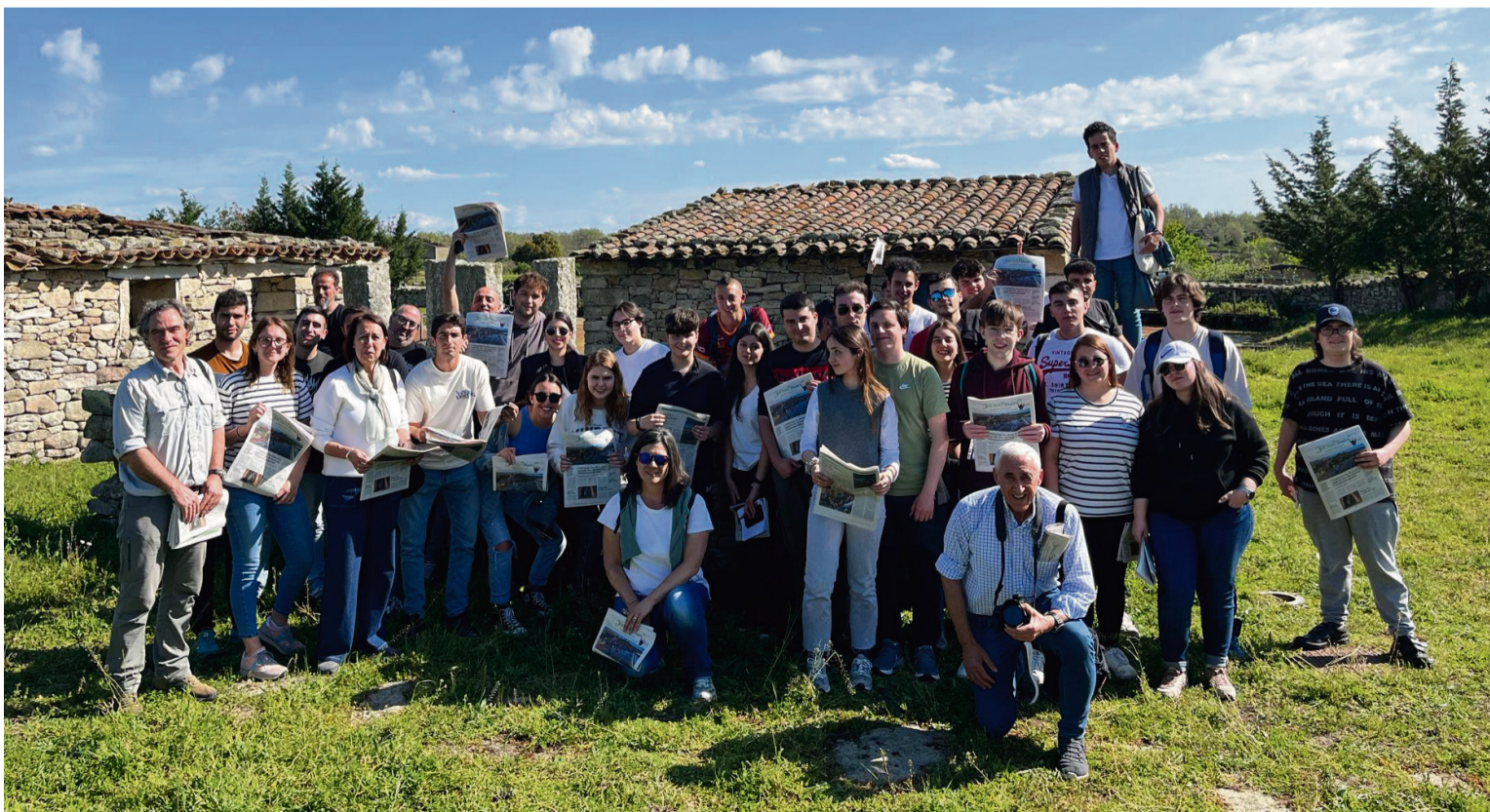
LOS ESTUDIANTES DE LA UVA FUERON LOS PRIMEROS EN RECIBIR EL JORNAL DEL DUERO / AECT Duero-Douro

La salida de campo finalizó en el mirador de la Presa de Almemdra.