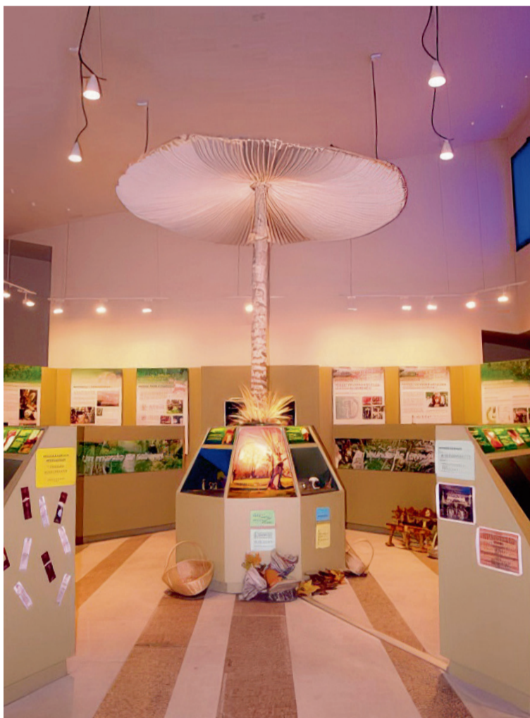
MUSEO MICOLÓGICO DE RABANALES / aytorabanales.es

Un espacio único dedicado a conocer las setas que pueden encontrarse en los bosques de la Comarca de Aliste y alrededores