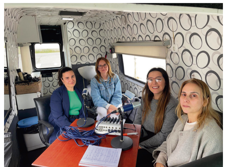
LAS PARTICIPANTES EN LA TERTULIA DE EMPRESARIAS / AECT Duero-Douro