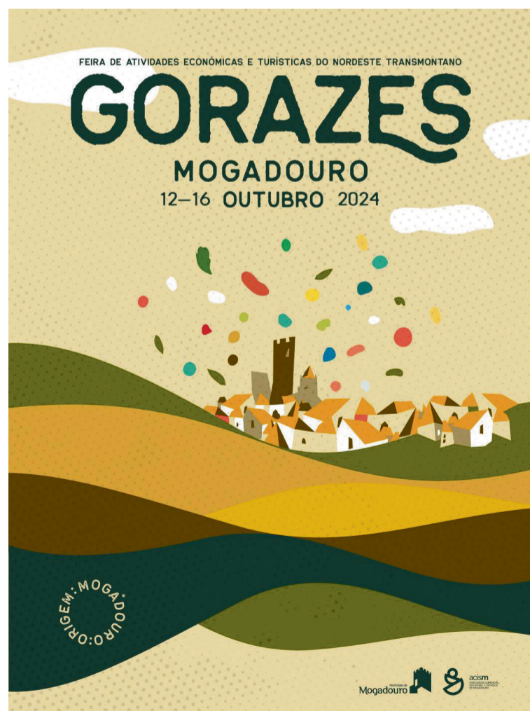
CARTEL / Municípios

Em outubro, a feira anual de Gorazes regressa a Mogadouro, entre os dias 12 e 16. É uma das feiras anuais mais antigas de Portugal, com registos que datam desde 1760. Não é apenas uma feira tradicional, é um local de diversão e um ponto de encontro importante para o comércio de artesanato e de outros produtos tradicionais.