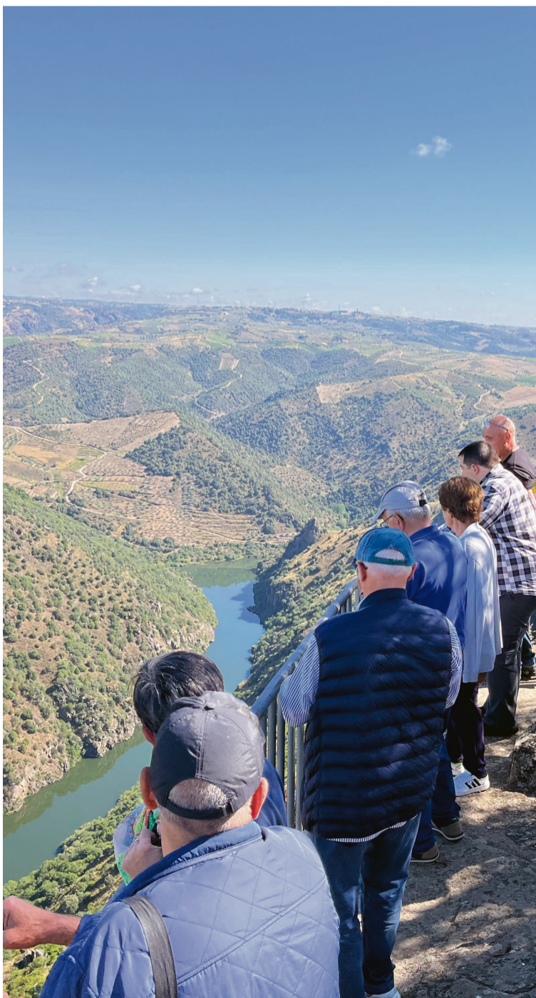
GRUPO DE PARTICIPANTES EN PEREÑA DE LA RIBERA / AECT Duero-Douro

En la actividad participaron diferentes personas del sector de la viticultura interesadas en profundizar sus conocimientos del territorio.