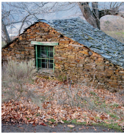
HERMISENDE (VIVIENDA) / AECT Duero-Douro

Entendemos por gentrificación aquel fenómeno que desplaza a las personas que habitualmente han vivido en un lugar movidos por el aumento del precio de la vivienda síntoma de la especulación inmobiliaria. Estas viviendas pasan de estar destinadas al uso habitual (vivir), para ser destinadas a otros usos como el alquiler turístico. Este fenómeno se da en la ciudad, pero en un momento donde el acceso a la vivienda de la población está en el centro del debate, nos preguntamos: ¿está afectando a nuestros pueblos del entorno rural?