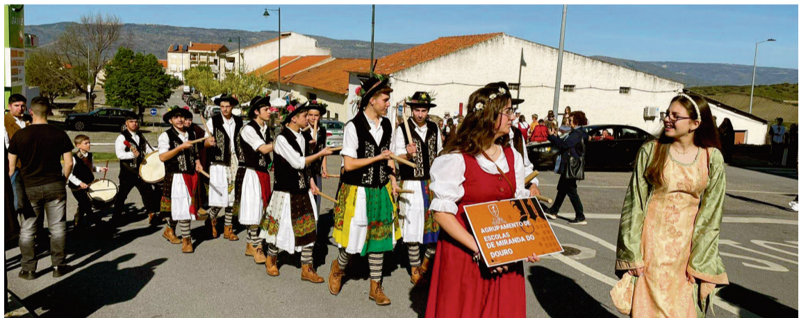
AGRUPAMENTO DE ESCOLAS MIRANDA DO DOURO / AECT Duero-Douro

Esta atividade está prevista no âmbito dos intercâmbios educativos dirigidos aos alunos entre escolas de ambos os lados da fronteira programados no desenvolvimento do projeto CESCOT- Consolidação de estratégias sectoriais de cooperação transfronteiriça. Rede ativa e participação, 0024_CESCOT_6_E , financiado pelo programa INTERREG VI-A Espanha Portugal 2021-2027 POCTEP.