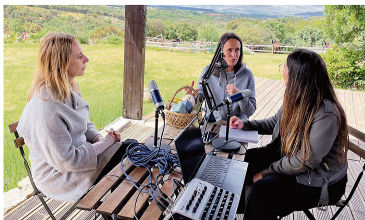
MOMENTO DE UNA GRABACIÓN DEL PODCAST

han abierto las puertas de sus propios negocios en el entorno rural. Todas ellas muestran que el territorio de la AECT Duero-Douro se encuentra muy vivo. Pags. 12 y 13