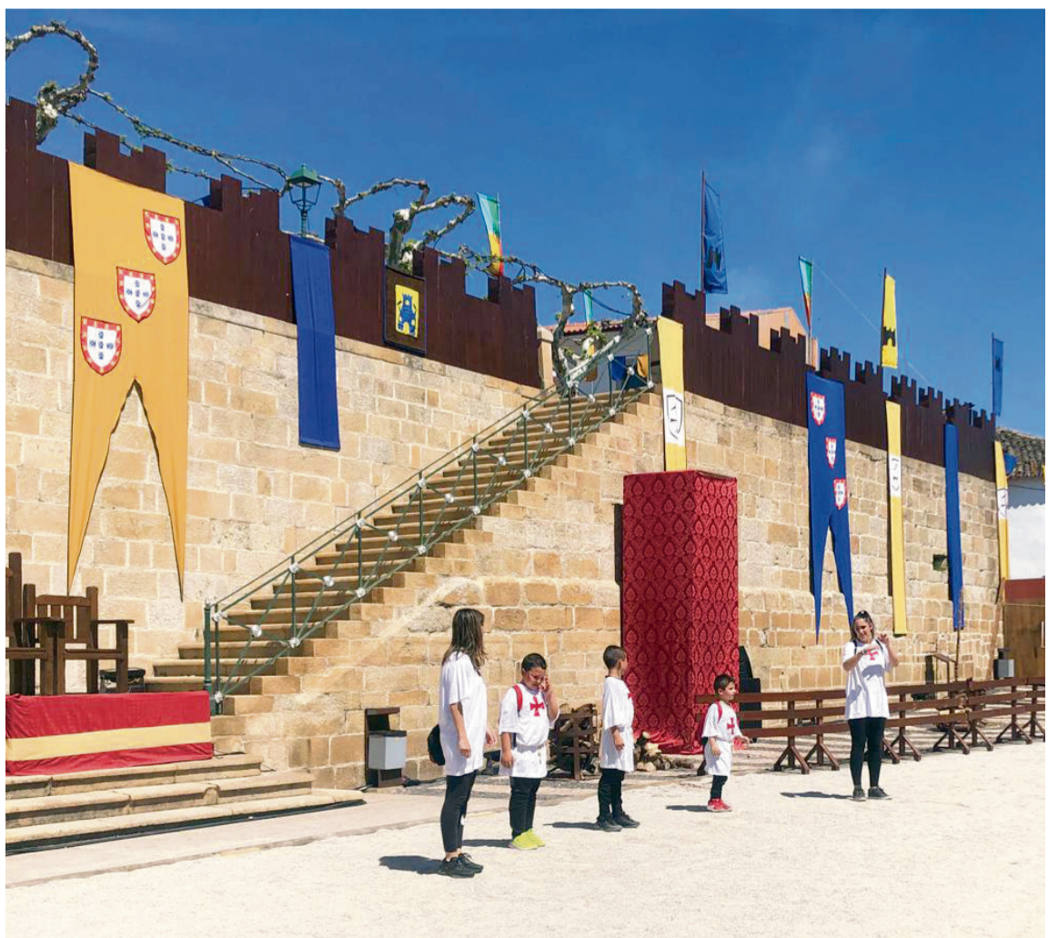
CEIP ALMARAZ DE DUERO / AECT Duero-Douro