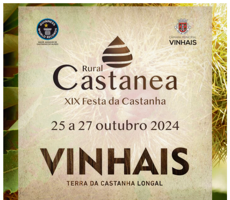
CARTEL XIX FESTA DA CASTANHA