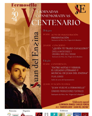
CARTEL / Municípios

Fermoselle, cuna que le vio nacer, ha homenajeado este verano a su ilustre artista, con la celebración de las Primeras Jornadas del V Centenario que llevan su nombre y que el Ayuntamiento ha organizado para conmemorar y ensalzar su