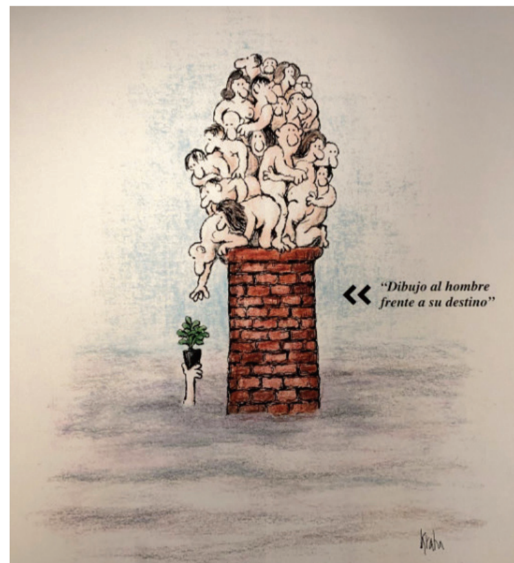
ILUSTRACIÓN / Fernando Krahn

Más info en: https://larecicladoracultural.es/exposicion/fernando-krahn-dibujos-para-reflexionar-exposicion-de-ilustraciones/