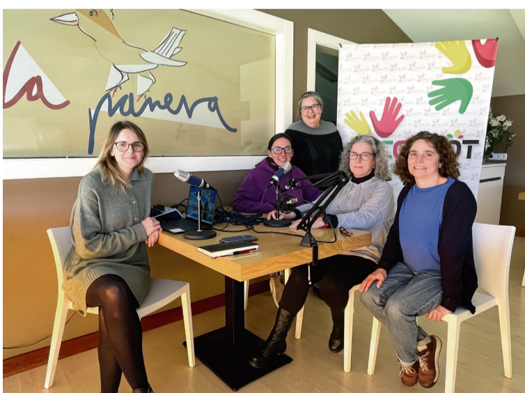
ESTUDIO DE RADIO EN EL SALÓN DE BELLEZA EN MONLERAS / AECT Duero-Douro

da, saiu da capital onde exercia o trabalho de contabilista para continuar a trabalhar remotamente na aldeia do seu marido. A par da sua profissão, criou a Pítica de Dius , um negócio que se dedica ao artesanato têxtil bordado em Mirandês, a segunda língua oficial portuguesa. Da vontade pela dinamização deste território, aceitou o desafio do marido e juntos criaram um projeto de turismo na aldeia. Ainda em fase embrionária, o L Pipo an Ruodas , é uma experiência que junta uma bicicleta coletiva a uma paisagem magnífica, comida, bebida e muita diversão.