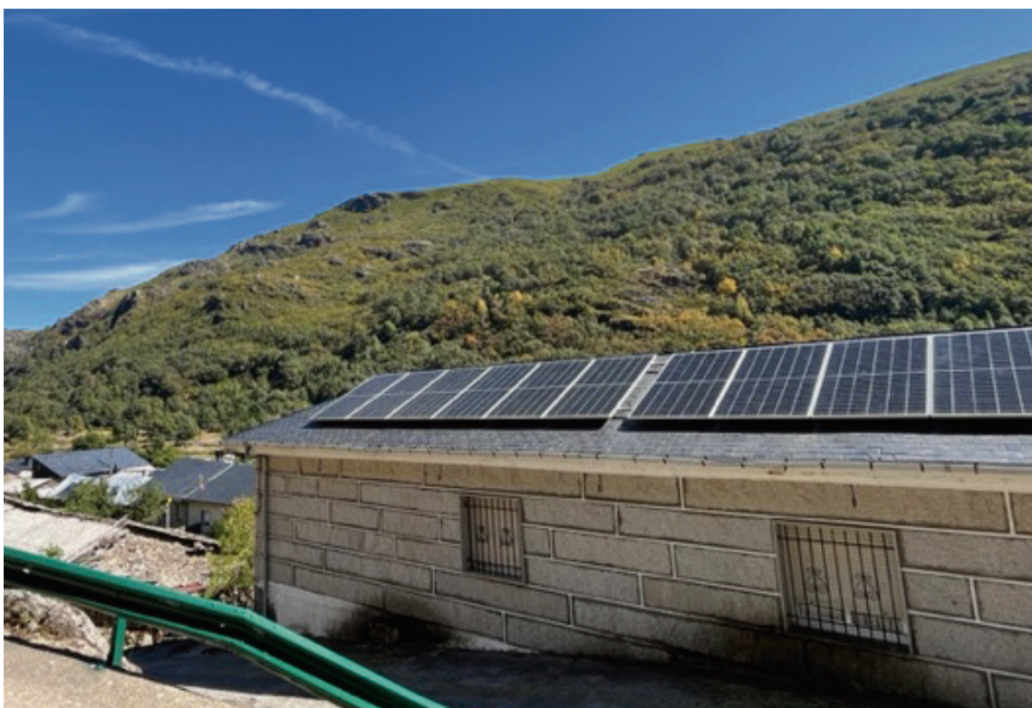
INSTALACIÓN FOTOVOLTAICA EN CENTRO SOCIAL DE BARJACOBA - PÍAS (Zamora) / AECT Duero-Douro