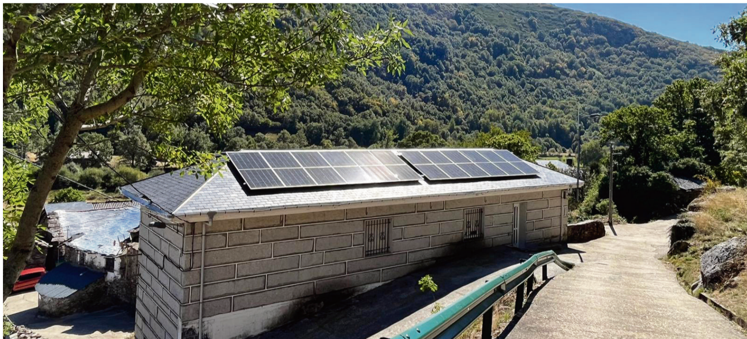
INSTALACIÓN FOTOVOLTAICA EN EL CENTRO SOCIAL DE BARJACOBA - PÍAS (Zamora) / AECT Duero-Douro

Transformación y Resiliencia , y la Comunidad Energética Efiduero Energy y con el apoyo del Banco Santander como partner financiero. Pags. 4 y 5