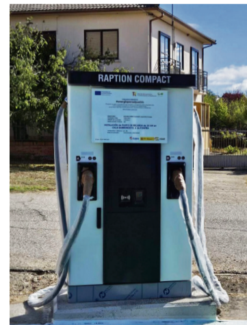
FONFRÍA (Zamora) / AECT Duero-Douro

Para informar sobre cómo ha transcurrido el desarrollo de las obras, como ha sido el proceso de justificación de las mismas ante el IDAIE , y resolver todas las dudas, el pasado 1 de octubre los diferentes alcaldes y secretarios de los municipios que forman parte de la comunidad, se reunieron en Zamora.