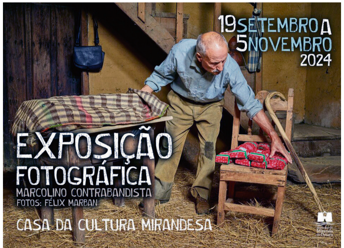
CARTEL / Municípios

Quase sempre de noite, voltavam de madrugada carregando cortes de bombazina (pana) para fazer calças dos lavradores. Também traziam com frequência lenços finos para a cabeça e alpergatas de corda.