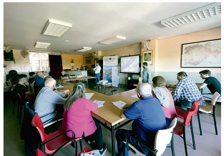
SESIÓN PRÁCTICA DEL TALLER EN EL AULA / AECT Duero-Douro