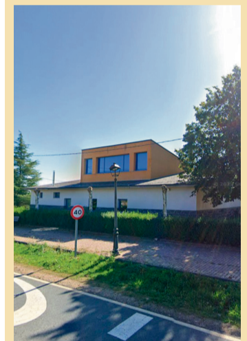
EXTERIOR DEL MUSEO

Se puede completar la visita a Rabanales asistiendo al Museo de los Castros de Aliste, que de hecho se encuentra en el mismo edificio, recorrer los propios Castros así como acudir a descubrir el Molino de Agua de Los Genicios en la localidad de Mellanes.