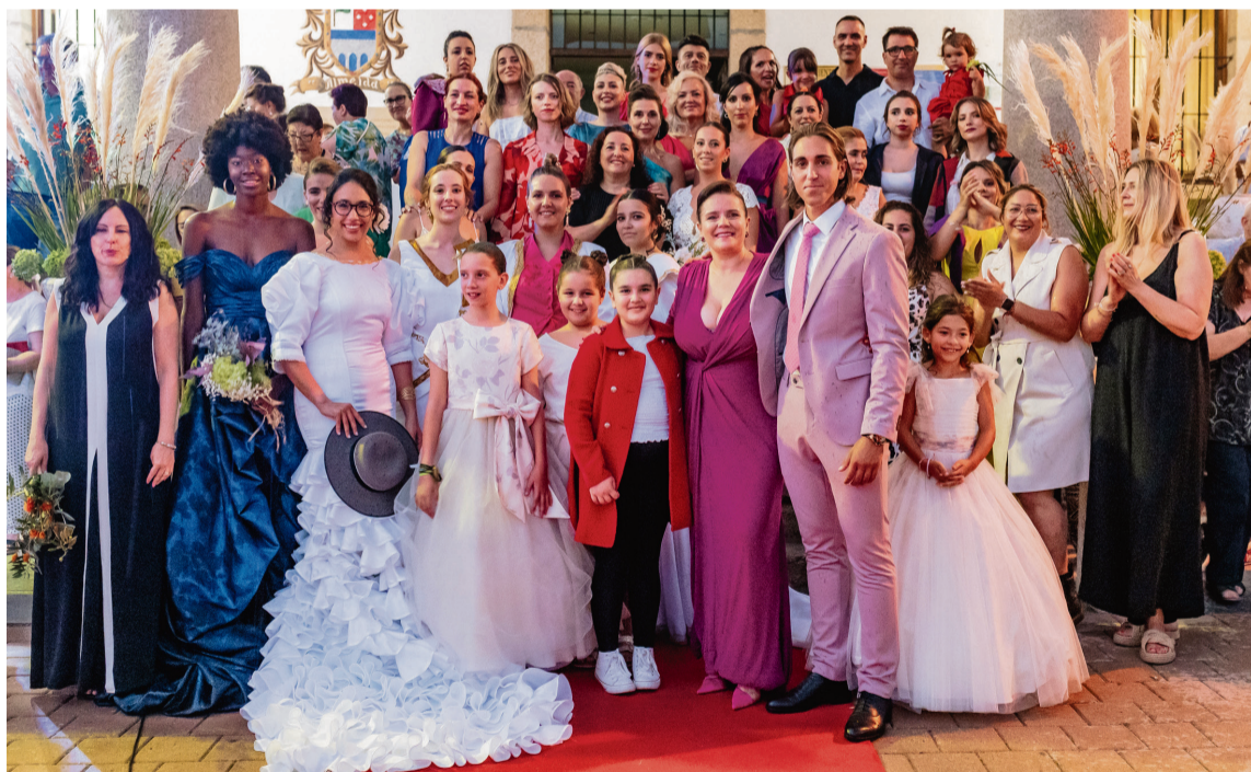
MOMENTO DEL DESFILE EN ALMEIDA DE SAYAGO / Municipios

El objetivo de este evento profesional de moda es ofrecer a los pueblos desfiles de moda con el mismo nivel de organización que las pasarelas de Madrid, Barcelona y Milán, para ensalzar el poder de la Marca Zamora y fomentar el desarrollo rural.