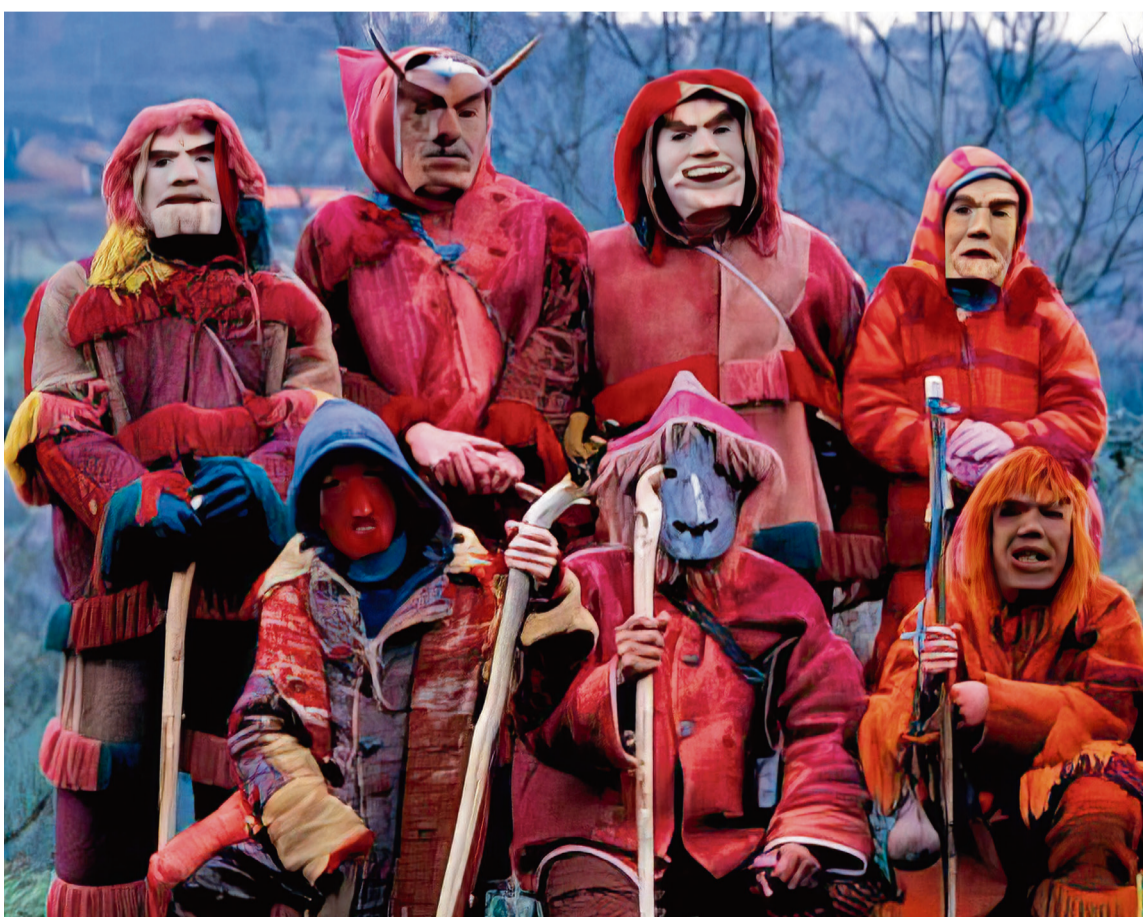
FESTA DOS CARETOS OU DAS VARAS, REBORDELO / AECT Duero-Douro

Vinhais (Portugal): Rural Castanea, XIX Festa da Castanha . Do 25 ao 27 de outubro