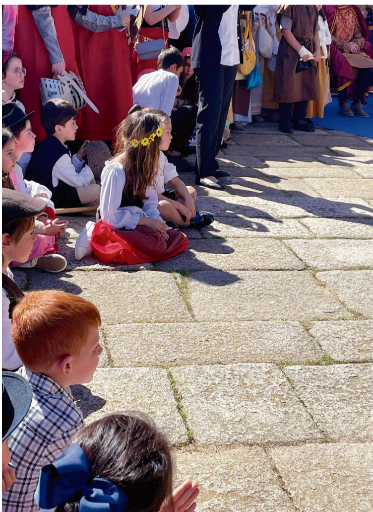
AGRUPAMENTO DE ESCOLAS DE MOGADOURO / AECT Duero-Douro