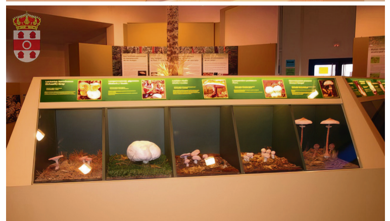
MUSEO MICOLÓGICO DE RABANALES / aytorabanales.es