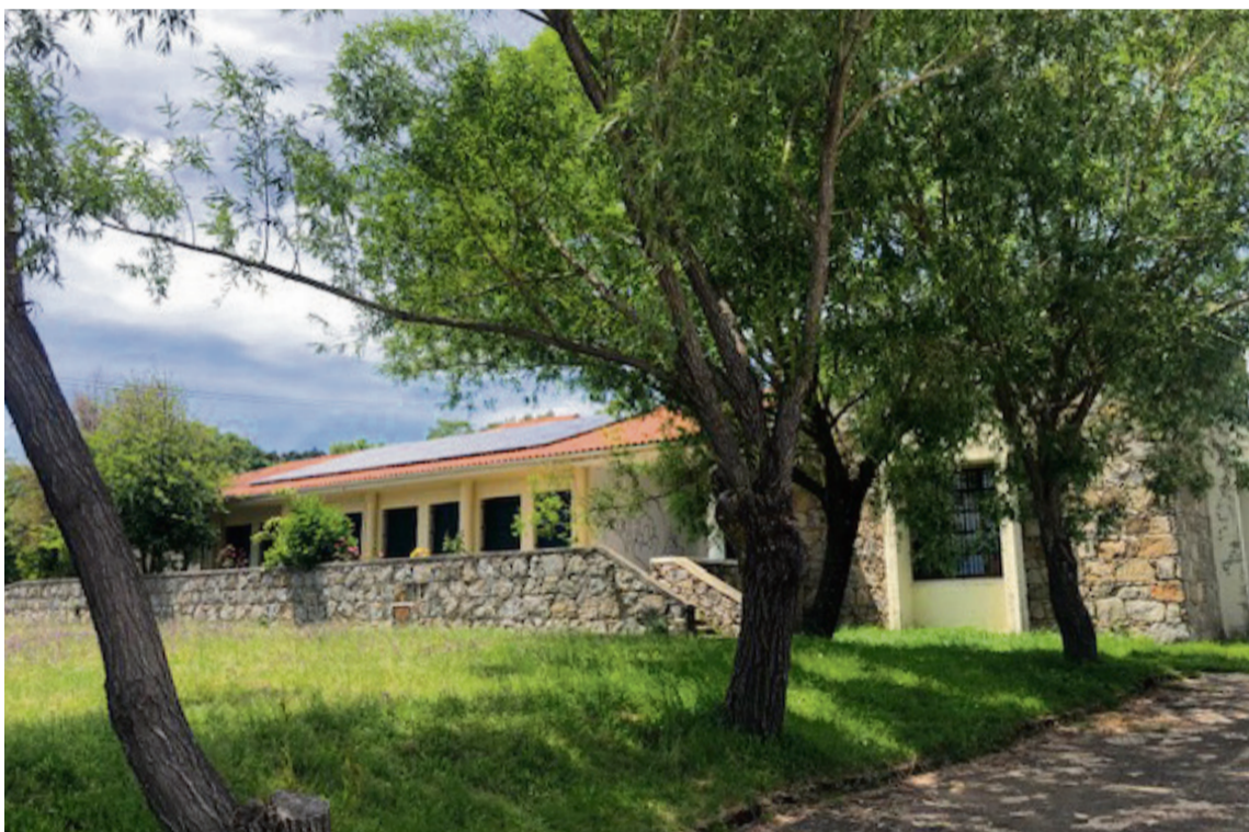
INSTALACIÓN FOTOVOLTAICA EN EL COLEGIO DE PEÑAPARDA (Salamanca) / AECT Duero-Douro

La inversión total realizada es de 2.170.442 euros