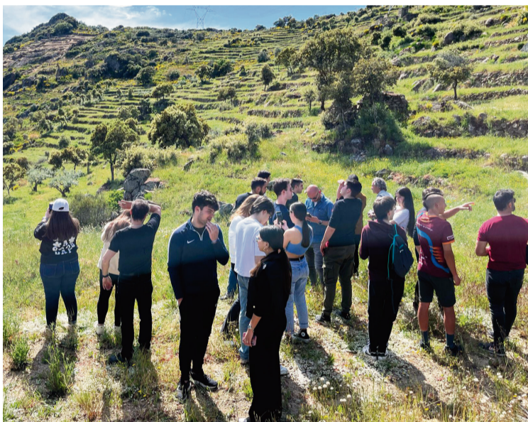
CONOCIENDO LA RECUPERACIÓN DE BANCALES EN ARRIBES / AECT Duero-Douro