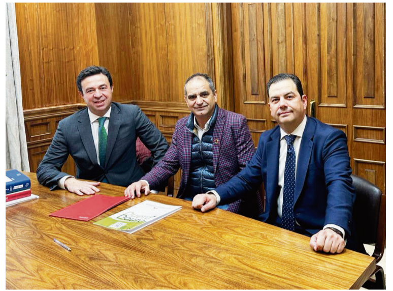
MOMENTO DE LA FORMALIZACIÓN DEL ACUERDO

Esta es la segunda vez que Efiduero Energy cuenta con el apoyo de la entidad