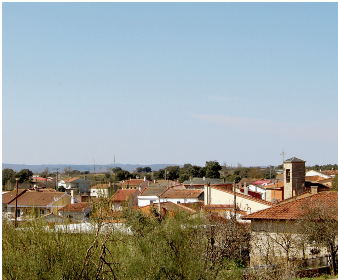
VISTA DE FONFRÍA (Zamora), UNO DE LOS MUNICIPIOS AFECTADOS

Se trata de un hecho que ha salido a la luz tras la puerta en marcha del proyecto sobre energía renovables y transición energética, #energíaparaelpue-