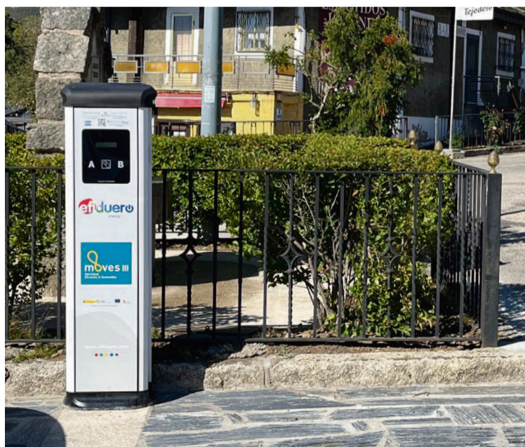
PUNTO DE RECARGA EN REQUEJO (Zamora) / AECT Duero-Douro