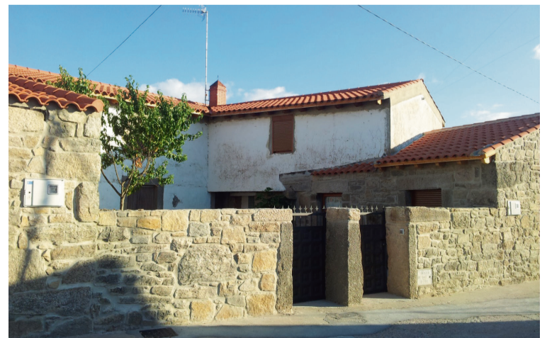
VIVIENDA EN SAYAGO / Pablo Garrido

En Madrid, País Vasco o la costa mediterránea, tan sólo el 6% de las viviendas están deshabitadas. Estos datos contras-