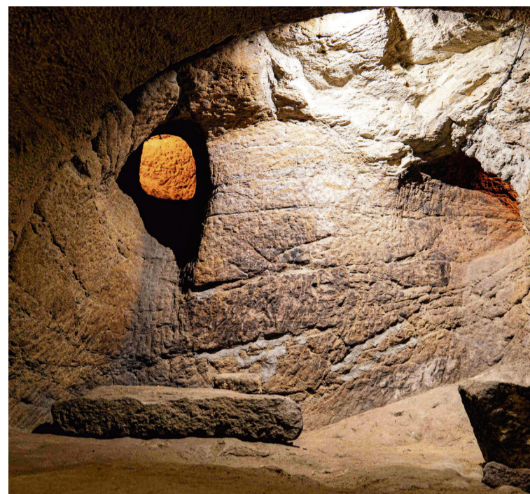
BODEGA "EL RINCÓN DEL CASTILLO" EN FERMOSELLE

El consorcio tiene como beneficiarios principales la Cámara Municipal de Mogadouro , el Ayuntamiento de Fermoselle y la AECT Duero-Douro . Como socios se encuentran la Junta de Freguesías de Urrós , la Diputación de Zamora , la Mancomunidad de Municipios de Baixo Sabor - Lagos do Sabor , la Comunidad Intermunicipal de Terras de Trás-os-Montes y Turismo de Oporto y Norte de Portugal .