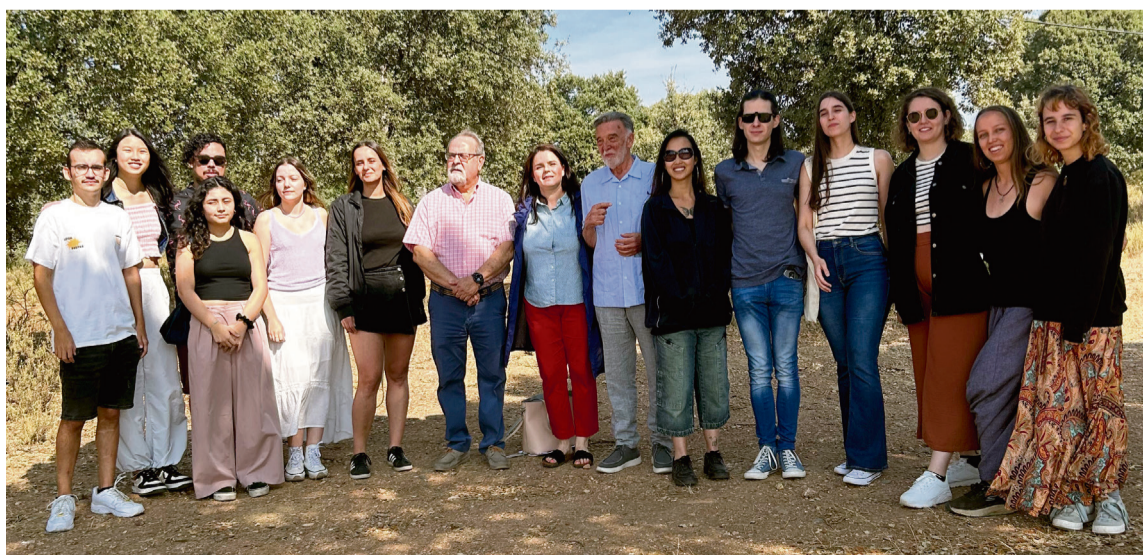
ENCUENTRO DE ESTUDIANTES PARTICIPANTES EN EL PROGRAMA CAMPUS RURAL EN ZAMORA

Uno a uno, el turno de palabra fue pasando a todos los estudiantes donde explicaron como estaban viviendo la experiencia de trabajar y vivir en los municipios de Fermoselle, Bermillo de Sayago, Almeida de Sayago, Fariza y Tábara, situados todos ellos en el entorno rural zamorano.