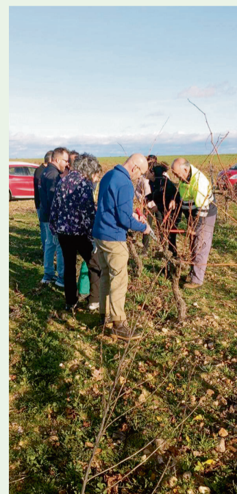
PRÁCTICA DE VITICULTURA / AECT

-Para renovarlo se debe cumplimentar el formulario de solicitud de renovación y el modelo 046 de la JCYL para pagar la correspondiente tasa de 4,11 euros para la emisión de un nuevo carné. La documentación hay que tramitarla en la Consejería de Agricultura, Departamento de Sanidad Vegetal .