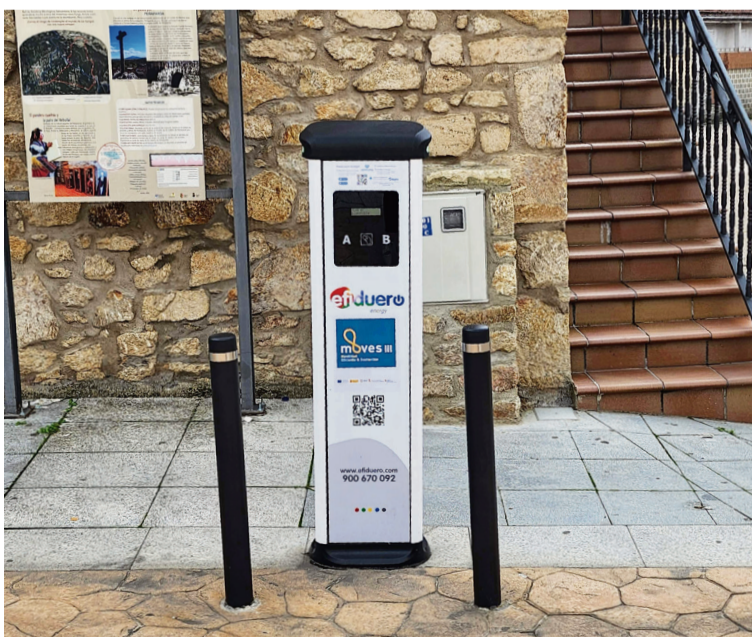
PUNTO DE RECARGA EN PEÑAPARDA (Salamanca) / AECT Duero-Douro

Todas las direcciones se encuentran recogidas en el siguiente mapa enlazado en este QR