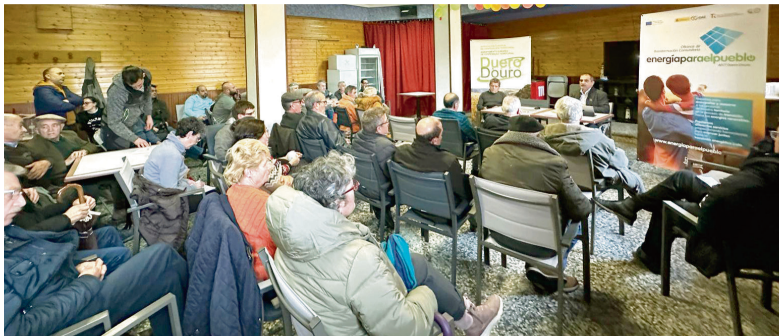
CHARLA INFORMATIVA EN VILLAMAYOR DE CAMPOS / AECT Duero-Douro

La OTC #energiaparaelpueblo es un proyecto que cuenta con el programa de concesión de ayudas a Oficinas de Transformación Comunitaria para la promoción y dinamización de comunidades energéticas (CE OFICINAS) , se enmarca en la componente 7 «Despliegue e integración de energías renovables» del Plan de Recuperación, Transformación y Resiliencia para la ejecución de los fondos Next Generation EU.