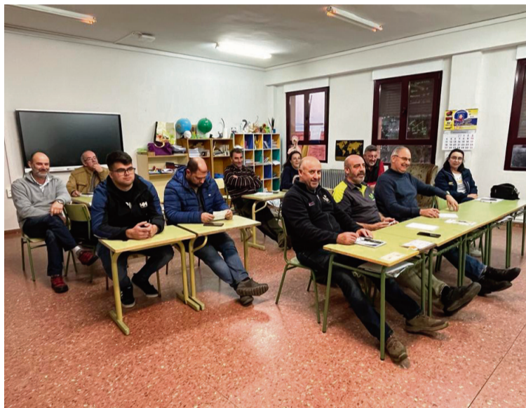
ALUMNADO DURANTE UN CURSO DE FITOSANITARIOS

La AECT Duero-Douro , en colaboración con el Ayuntamiento de Rabanales de Aliste y la Asociación Cultural Fuente-