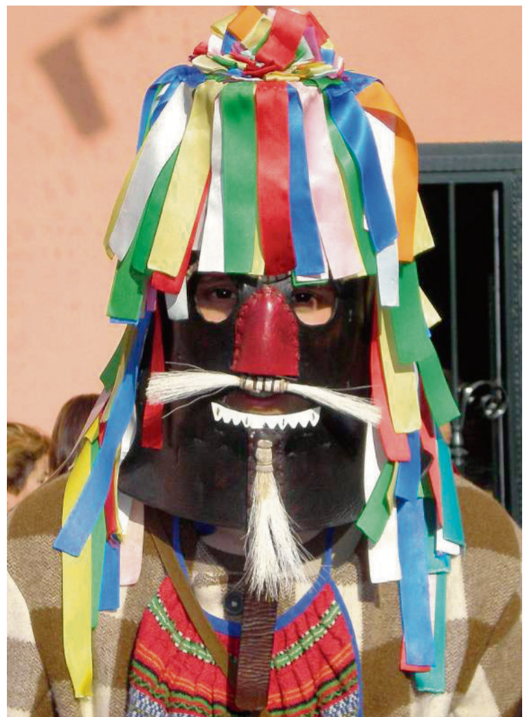
ZANGARRÓN DE SANZOLES / AECT Duero-Douro

8 DOMINGO Castroverde de Campos (Zamora, España). La Purísima 25-26 MIÉRCOLES / QUARTA-FEIRA Ousilhão (Vinhais, Portugal). Festa de Santo Estêvão ou Festa dos Rapazes Rebordelo (Vinhais, Portugal). Festa dos Caretos ou das Varas 26 JUEVES / QUINTA-FEIRA Sanzoles (Zamora, España). El Zangarrón . Fiesta de Interés Turístico Regional La Tejera (Zamora, España). Fiesta de San Esteban 27 VIERNES / SEXTA-FEIRA Travanca (Vinhais, Portugal). Festa de Santo Estêvão 31 MARTES / QUARTA-FEIRA Moveros (Zamora, España). Fiestas de Santa Colomba Vale das Fontes (Vinhais, Portugal). Encamisada