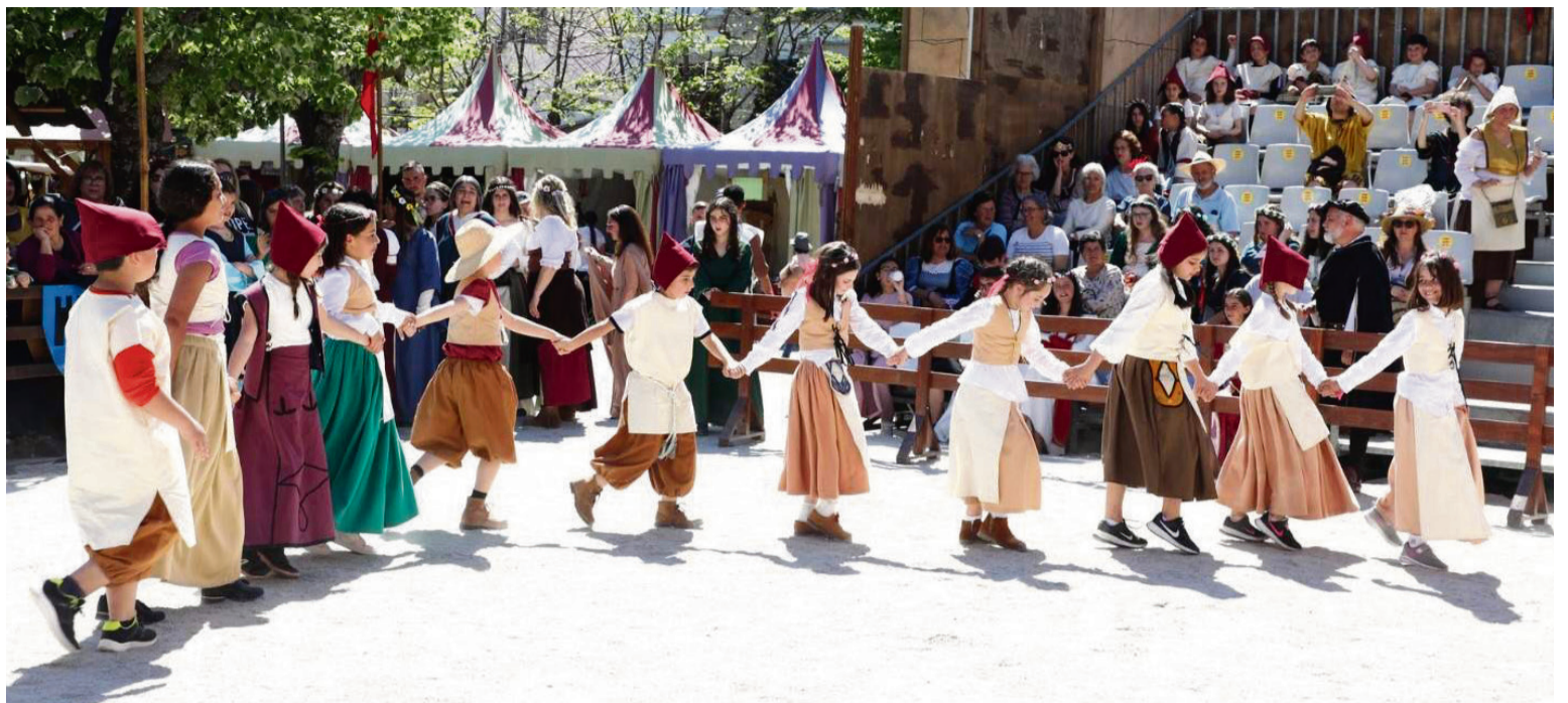
ESCOLA BÁSICA SENDIM / AECT Duero-Douro

Uma das principais atrações é o mercado medieval composto por cerca de 90 artesãos, mercadores, místicos e taberneiros que, durante os três dias, vendem os produtos da época e também os produtos locais do concelho de Moncorvo. As bancas do mercado são envolvidas por um espírito festivo que anima todas as ruas com trovadores, músicos, mendigos, bobos da corte, mabaristas, conjurados, cuspidores de fogo e bailarinas, acrobatas, frades, guerreiros e cavaleiros... Na zona alta, por detrás da Câmara Municipal, encontra-se a zona das tabernas e restaurantes de estilo medieval. Pode ainda conhecer os ofícios tradicionais ligados ao ferro, com um vasto conjunto de forjas ao vivo.