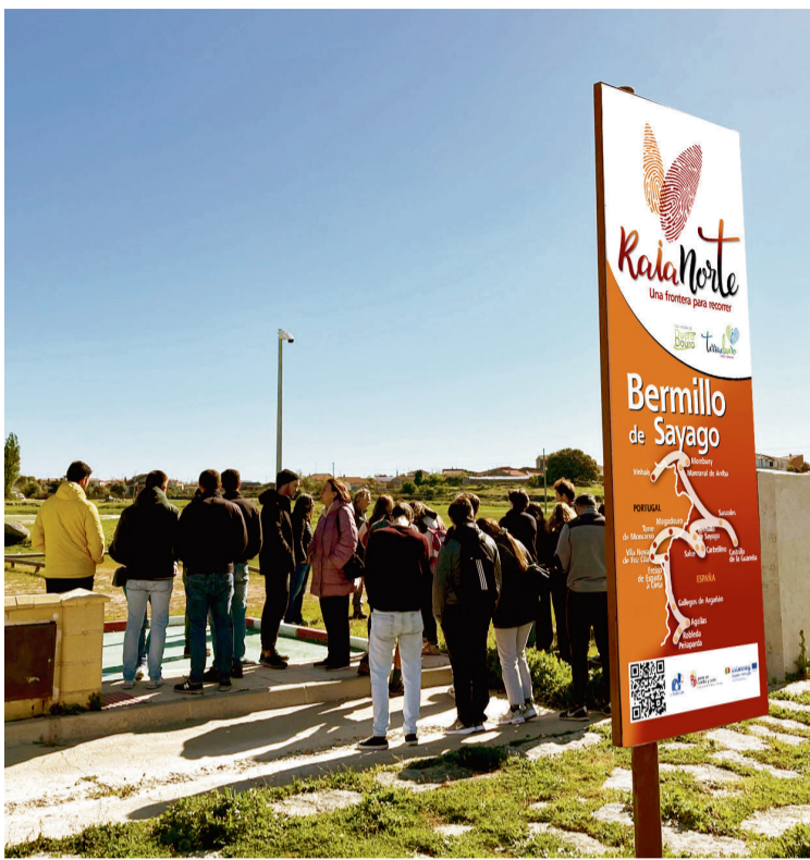
VISITA AL ÁREA DE AUTOCARAVANAS DE BERMILLO / AECT Duero-Douro