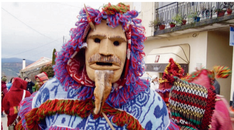
FESTA DOS CARETOS OU DOS RAPAZES, OUSILHÃO / AECT Duero-Douro